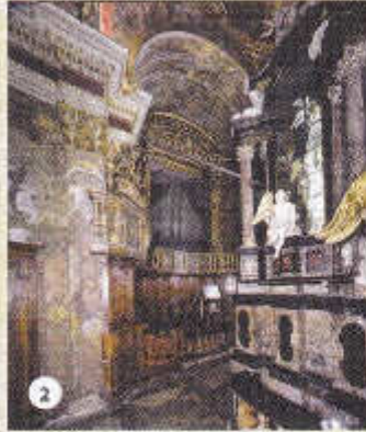
2 - ORGUE - L'original date de 1531 et fut construit dans l'atelier d'Antegnati à Brescia. Placé à l'origine sous la fenêtre à grille devant la nef centrale, il fut transféré dans l'abside en 1578 et reconstruit par Biroldi au 19ème siècle, après un incendie.