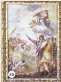
b – La prophétie encourageante de la Vierge