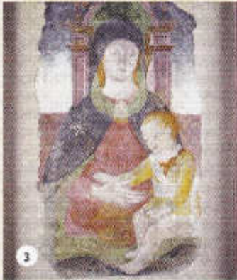
3 - LA VIERGE ET L'ENFANT - Fin du 15ème siècle (époque de Ludovico Il Moro). La fresque est ce qu'il reste d'une peinture plus importante datant de l'époque Sforzesco.