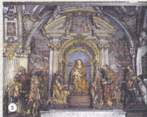
5 - AUTEL - L'ADORATION DES MAGES (1510/1530 ?) Statues en bois peintes et dorées, artiste inconnu (peut-être Andrea Da Milano).