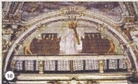
c – Bataille autour de la tour