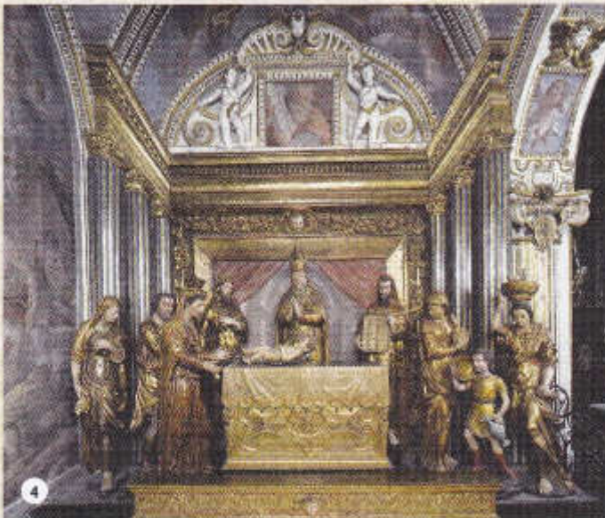
4 - AUTEL - PRESENTATION DU CHRIST AU TEMPLE ou CIRCONCISION (vers 1580) - Perspective de Pellegrino Tibaldi - Les statues en bois peintes et dorées sont attribuées à Andrea Prestinari.