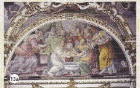
a – La Naissance de la Vierge