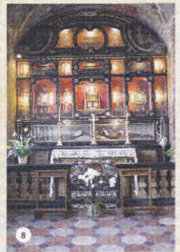
8 - LA CHAPELLE DES SAINTS (1669) - L'autel en marbre et le retable abritent les corps de Sainte Catherine et Sainte Juliano, co-fondatrices du couvent affilié à l'église de pèlerinage, ainsi que de nombreux reliquaires. Dans la voûte se trouve une peinture d'Antonio Busca (1686), « La Gloire des Saints » ; les structures peintes sont attribuées aux frères Grandi.