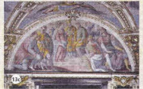
c – Le Mariage de la Vierge