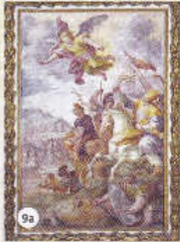
9 – VICTOIRE DE SAINT AMBROISE SUR LES ARIENS ET CONSECRATION DU MONT VELATE A LA SAINTE VIERGE – Fresque en quatre parties de Salvatore Bianchi (1696)